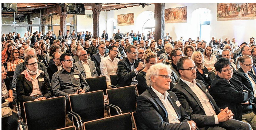
Filter Bubble, Bequemlichkeit, künstliche Intelligenz: Top-Speaker und Trendanalytiker, Dr. David Bosshart, zeigte mit diesen und weiteren spannenden Begriffen beim 7. Konstanzer Unternehmerfrühstück auf, wie sich die Zukunft für UnternehmerInnen verändert. Er gab rund 350 UnternehmerInnen und Führungskräften im historischen Konzilgebäude einen informativ-überzeugenden Einblick in die digitale, immer transparenter werdende Welt, in der gegenseitiges Vertrauen und Selbstreflexion elementar wichtig sind und letztendlich zum Erfolg führen. Mehr Fotos gibt es im Zeig Dich auf Seite 10.