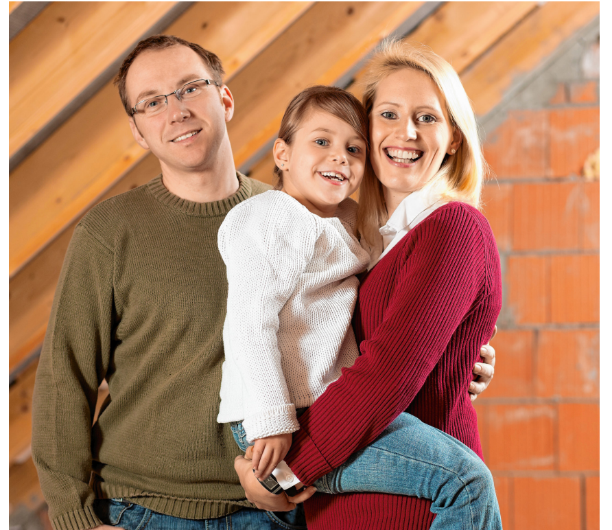
Das Baukindergeld soll Familien angesichts rasant steigender Immobilienpreise entlasten.

Die in diesem Jahr per Gesetz beschlossene, staatliche Förderung kann inzwischen bei der KfW-Bank beantragt werden. Doch dabei gilt es einiges zu beachten. Online werden die persönlichen Daten eingegeben und der Antragsteller muss sich in einem mehrstufigen Prozess per Videochat – samt Ausweisdokument – persönlich identifizieren. Das erfordert etwas Geduld. Zum Start gab es einen enormen Andrang, die Website war teils überlastet. Hinzu kommt: Die notwendigen Dokumente und Belege lassen sich aus